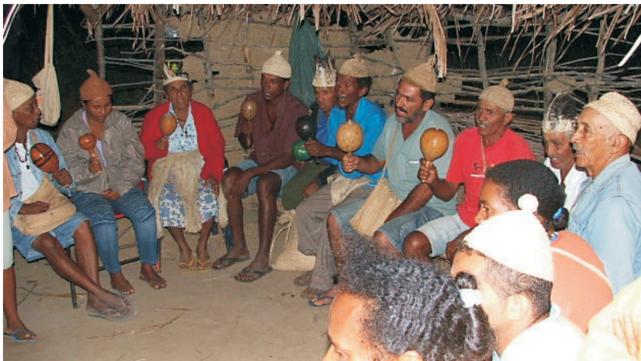
Ritual Tumbalalá (NECTAS, 2008)