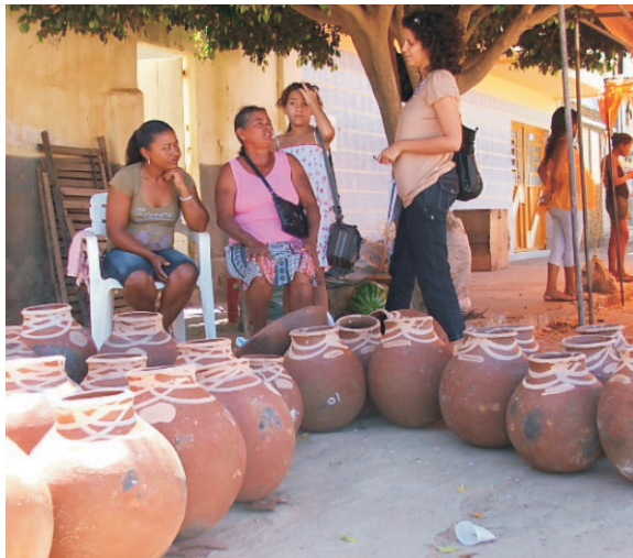
Cerâmica Tumbalalá (NECTAS, 2008)