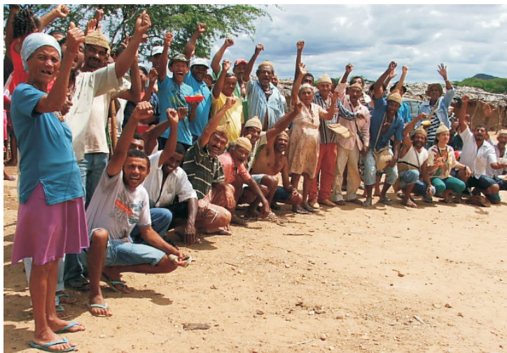
Participantes da Oficina (NECTAS, 2008)