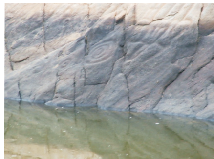
Pedra da Letra (NECTAS, 2008)

Os símbolos gravados na Pedra da Letra comprovam a existência dos ancestrais do Povo Indígena Tumbalalá que habitavam neste território. São aspirais repetidos. O gesto de repetição traduz o gesto de cozinhar, mexer a “mistura”, é o movimento da vida, a semente que vai de centro em direção da luz e vive-versa. Nessa mistura somos o fogo e a terra, ligando panela de barro, pote, corpo, vaso sagrado. Nós Povo Tumbalalá somos resultado, parte do processo dessa fusão. Livro: “Índios na visão dos Índios”.