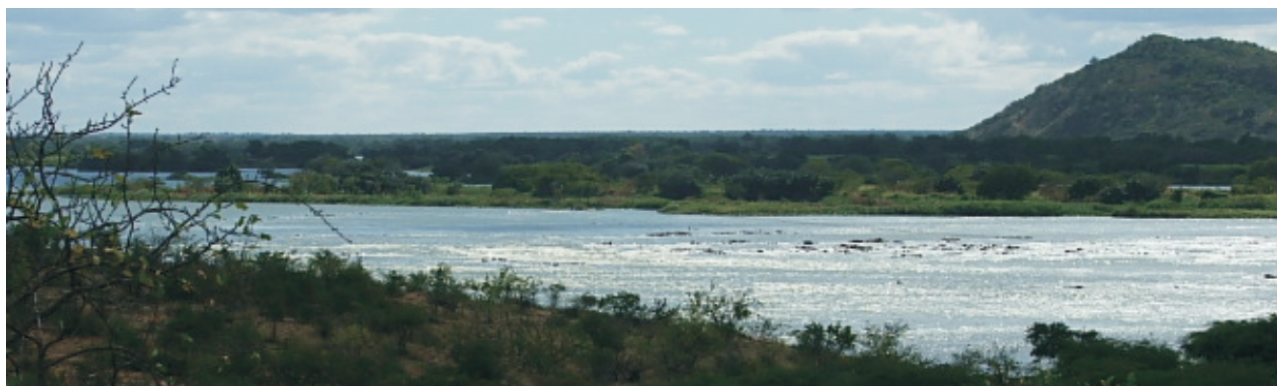
Área da Construção da Barragem (NECTAS, 2008)

O Rio trás nossas tradições que é os Encantados das águas e das matas. Aqui temos hora de tomar banho, hora de pescar. Tem que escutar o Rio. Cecília Tumbalalá.